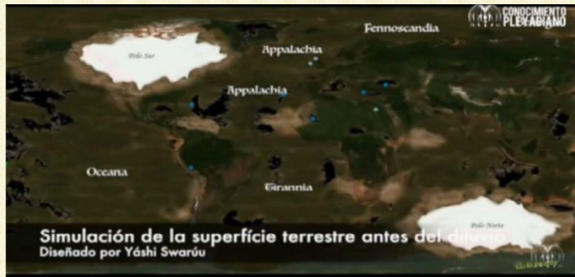
Simulatie van het aardoppervlak vóór de zondvloed

Dus, als zoveel massa water de planeet Aarde binnenkomt, verandert het volledig de delicate geologische en energetische dynamiek van de planeet zelf, omdat het als een dynamo of elektromagnetische generator is, die een stroom creëert door de grote hoeveelheid ijzerhoudend magnetisch materiaal in het magma. Dan wordt de rotatie beïnvloed, en met de rotatie, de dynamiek van de vorming van de magnetosfeer, omdat een planeet een zekere rotatie of interne stromen nodig heeft om zijn elektromagnetisme op te wekken. Dat wil zeggen, zijn rotatie en de interne bewegingen van het magma in relatie tot andere magmalagen binnenin de Aarde, creëren een dynamo-effect dat de magnetosfeer opwekt. Interessant genoeg, hetzelfde principe als een tegengesteld draaiende magnetische turbine van een ruimteschip. Wanneer de energiedynamica van de planeet wordt beïnvloed, veroorzaakt dit, naast het cataclysmen dat door de vloed wordt veroorzaakt, een verschuiving of verplaatsing van de polen, waardoor een omkering van de planetaire polariteiten ontstaat met de daaruit voortvloeiende gevolgen, verwoestend voor alle leven en biologie, zelfs voor de vorm van het terrein zelf.